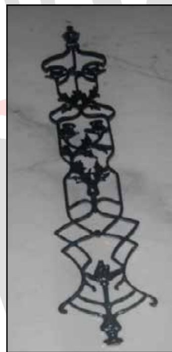
DECORO PICCOLO H. 95 CM L. 18,5 CM