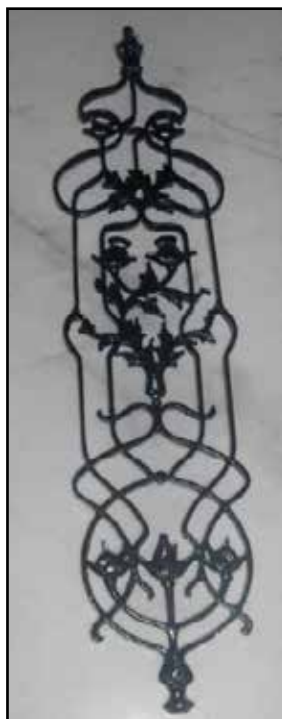
DECORO GRANDE H. 95 CM L. 23,5 CM