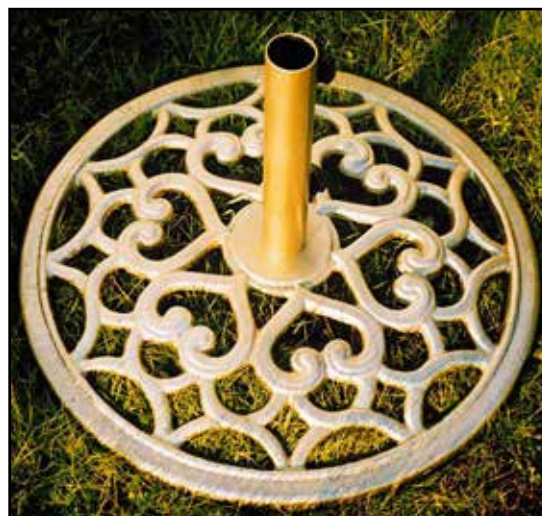
PORTAOMBRELLONE BASE TONDA Ø 580