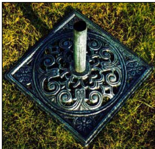
PORTAOMBRELLONE BASE QUADRA 460x460